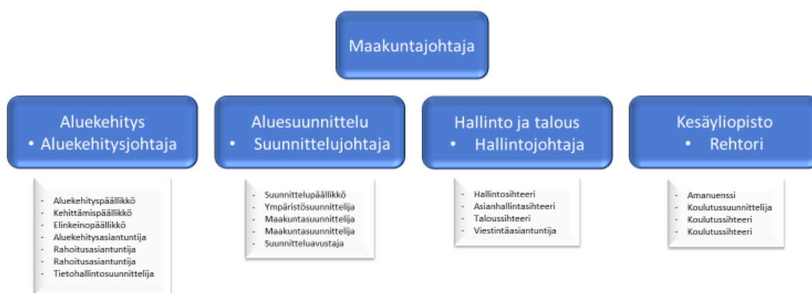
Kuva: Kymenlaakson liiton virasto-organisaatio v. 2023

Virasto on jaettu liiton toiminta-ajatuksen ja tehtävien tehokasta ja taloudellista saavuttamista varten neljään vastuualueeseen.