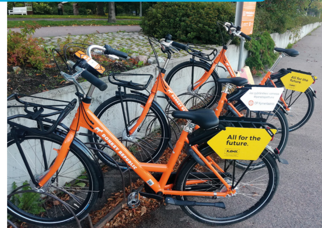
Kaupunkipyörät Kotkansaarella

Kotkassa ja Kouvossa on kaupunkipyöriä, joita voit hyödyntää siirtyessäsi junaan tai jatkaessasi asemalta määränpäähän.